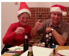
Britta og Bjerring klar til en festlig aften

Humøret var højt fra start. Efter sildemadder, m.m. og en lille en til ganen startede vi med vores traditionelle indledende sang, som handler om at være blandt visevenner.